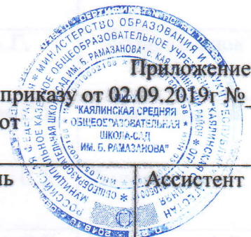
График проведения контрольных работ для учащихся 2-4 x классов